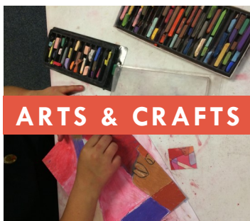
ARTS & CRAFTS